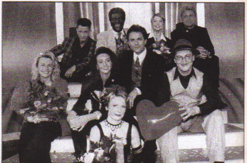
„Darf ich bitten“ In Alfons Haiders (M.) neuer Musikshow beurteilen Promis wie Rainhard Fendrich, Caroline Vasicek und Roberto Blanco das Können junger Talente.